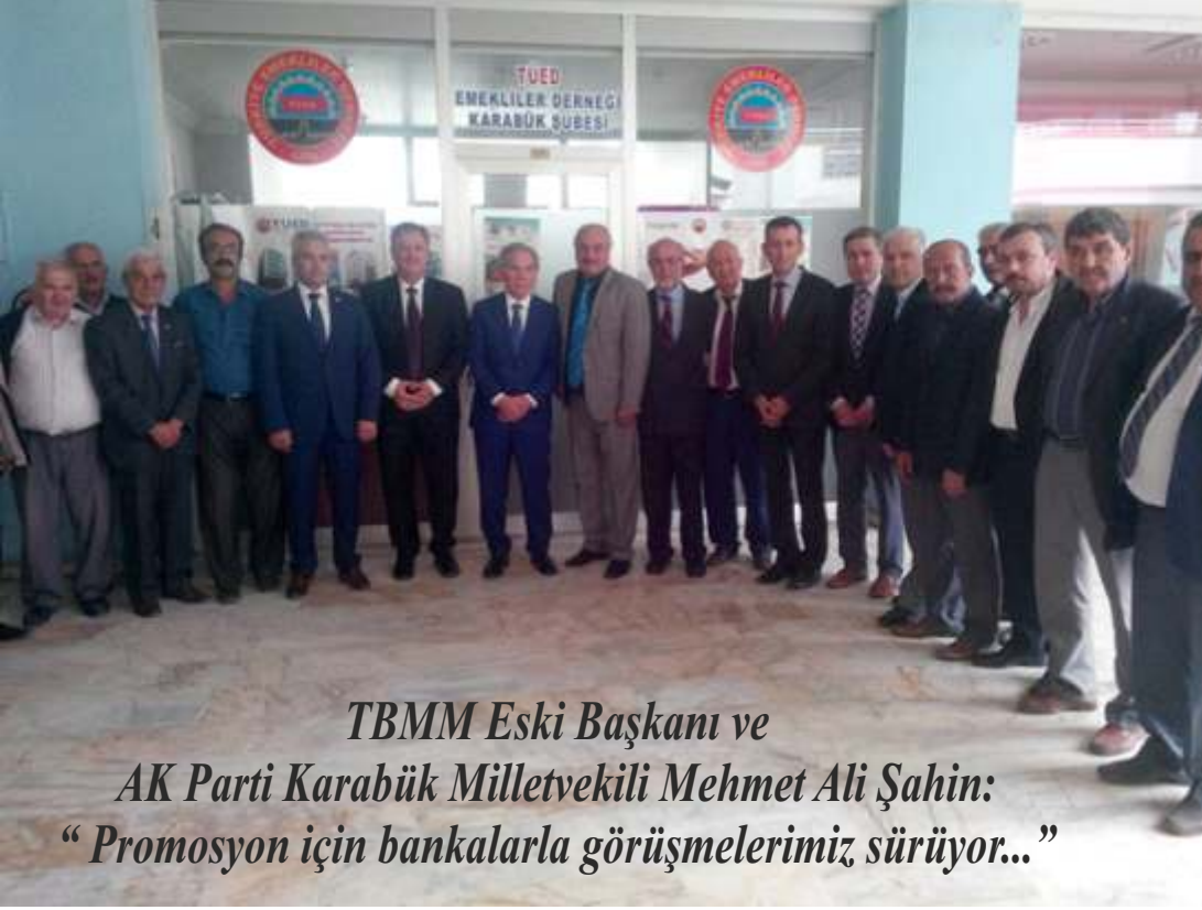
TBMM Eski Başkanı ve AK Parti Karabük Milletvekili Mehmet Ali Şahin: “Promosyon için bankalarla görüşmelerimiz sürüyor..”