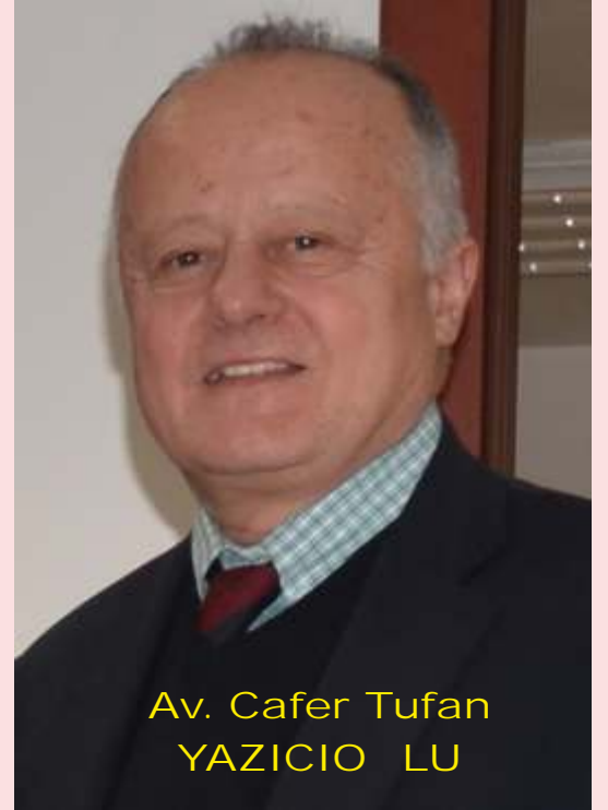
Av. Cafer Tufan YAZICIO LU

bekliyoruz. Bu gerçeikle ti inde 2000 sonrası emeklilerimiz de tek tek dava açmadan bu haktan yararlanmı olacak" dedi.