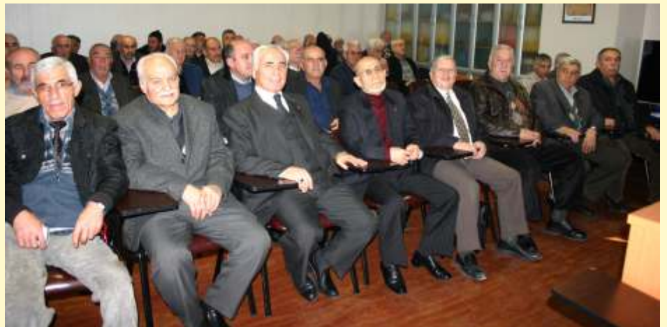
Tekden Hastanesi konferans salonunda gerçekleştirilen seminere Kayseri üemize üye emeklilerimiz yo un ilgi gösterdiler...