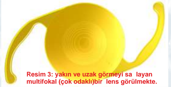
Resim 3: yakın ve uzak görmeyi sağlayan multifokal (çok odaklı) bir lens görülmekte.

ulaşılması, bu bize milimetrik kesilerle cerrahi yapabilmeye imkanı sağlamıştır. Ayrıca hastanın ihtiyaçlarına bağlı olarak sadece kataraktı almak değil aynı zamanda görme kusurlarını da düzeltebilmeye imkanı bize sunmaktadır; Premium lens dediğimiz bu lenslerle hastanın yüksek miyopisini veya hipermetropisini düzeltebilir, torik lenslerle astigmatı düzeltebilir, multifokal (çok odaklı) lenslerle yakın ve uzak gözlük bağımlılığını azaltabilmekte hatta ortadan kaldırmaktayız.