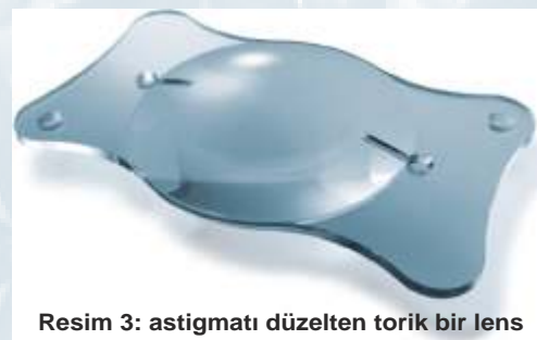
Resim 3: astigmati düzeltilen torik bir lens

Çünkü bilinenin aksine göz içine cerrahi olarak yerleştirilen lens (göz içi mercek) bu ameliyatlarda günümüzde operasyonun önemli bir parçası, olmazsa olmazdır. Ameliyatın sonunda göz içine yerleştirilir ve ömür boyu yerinde kalırlar. Eğer göz içi lensi yerleştirilmezse hasta uzun süre görmek için artı 10 numara civarında gözlük takmak zorunda kalır. Göz içi lensleri de teknolojik gelişimle çok yönlü katı, basit sabit yapıda sert lenslerden katlanabilir ve sonrasında göz içinde orijinal halini alabilen akrilik yumuşak lenslere