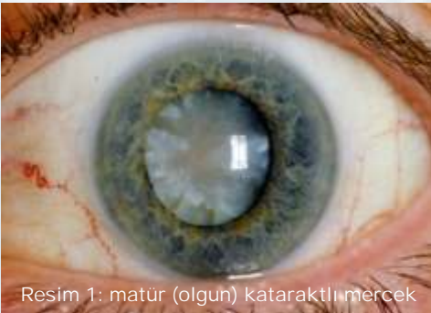
Resim 1: matür (olgun) kataraktlı mercek

Katarakt nasıl tedavi edilir? Kataraktın ilaç ile bir tedavisi yoktur, düzeltilmiş görme miktarında, ki burada