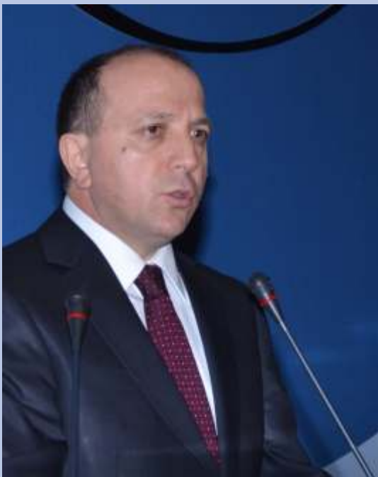
Fatih ACAR SGK Başkanı