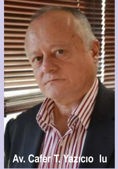
Av. Cafer T. Yazıcı o lu

Görünen o ki, Ceza davaları görülmese de, Hukuk davaları ilgili mahkemelerde devam edecektir. Keza, A HM de benzer bir kararında; SGK'nın takdir hakkını kabul etmi tir."