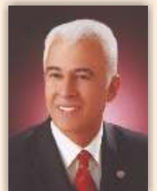
Kazım ERGÜN Genel Başkan

Sosyal güvenlik sistemimizin yarım asrı a an uygulamasına bakıldı nda, emeklilik hukukunda norm ve standart birli inin kurulamaması sonucunda, gelir ve aylıklardaki e itsizliklerin en büyük sorun olarak günümüze kadar geldi i açıkça görülmektedir. 5510 sayılı Sosyal Sigortalar ve Genel Sa lık Sigortası Kanunu, 1 Ekim 2008 itibariyle yürürlü e girmi ve bu tarih itibariyle tek bir emeklilik statüsünü benimsemi tir. Bir di er ifadeyle, 1 Ekim 2008 itibariyle ilk defa i e ba layan i çi, esnaf ve memur statülerinin emeklilik haklarında norm ve standart birli i sa lanmış tir. 1 Ekim 2008 öncesi emekli olanların durumlarında bir de i iklik olmadı ndan, emeklilerin gelir ve aylıklarındaki farklılıklara bir çözüm getirilmemi tir.